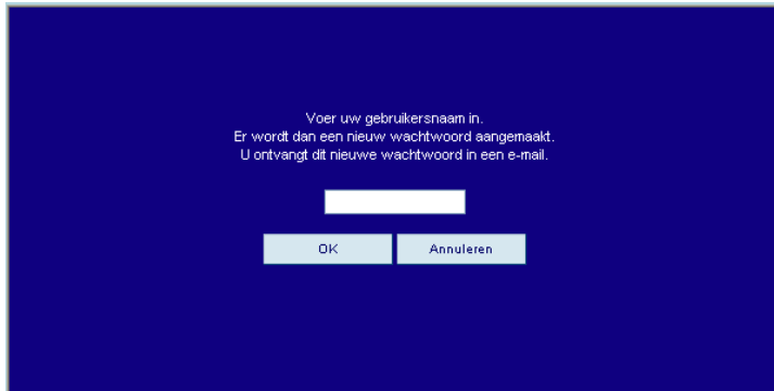
figuur 2: Wachtwoord vergeten

Indien u uw wachtwoord bent vergeten, klik dan op [Wachtwoord vergeten]. Er verschijnt dan een scherm (figuur 2) waarin u uw gebruikersnaam dient in te vullen. Nadat u dit heeft gedaan zal er een nieuw wachtwoord worden gegenereerd dat vervolgens via e-mail wordt toegestuurd aan de gebruiker die door de beheerder is geregistreerd (dit is doorgaans de polosecretaris van de vereniging). Het is daarom belangrijk dat het juiste e-mail adres bekend is bij de beheerder van deze applicatie.